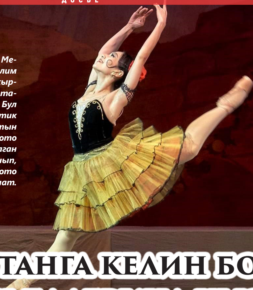
КАБАР: САМИРА ШАРИПОВА

28 жаштагы жапониялык балерина Мегуми Матсумото балериналык билим алуу үчүн Орусияда окуп жүрүп кыргызстандык жаш балет бийчиси Атабек Садыркулов менен таанышат. Бул таанышуу Матсумотонун кесиптик жана жеке жашоосунда жаңы барактын ачылышына себеп болот. Матсумото менен Садыковдун Орусияда башталган сүйүү романы Кыргызстанда уланып, акыры жапондук балерина Матсумото Кыргызстанга келин болуп калат.